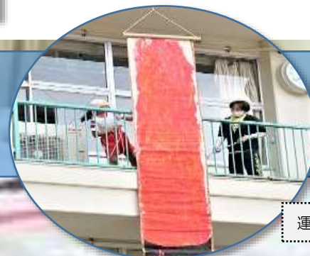
運動会を見守る伝統の聖火