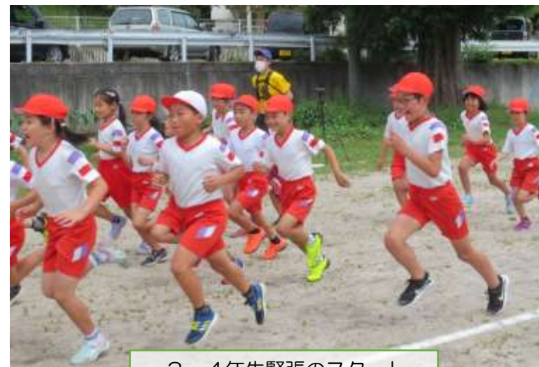
3・4年生緊張のスタート