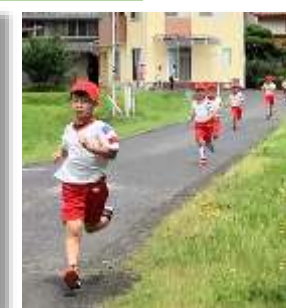
下りはスピードここのって

スポーツ特集の最後は、6月17日に実施した春季ロードレース大会です。低・中・高学年別に上阿井・大上方面を走りました。阿井幼稚園の園児のみなさんを始め、沿道にはご家族の皆さんや地域の皆さんに大勢応援していただき、子どもたちも皆さんの声援に後押しされ、全員が完走することができました。