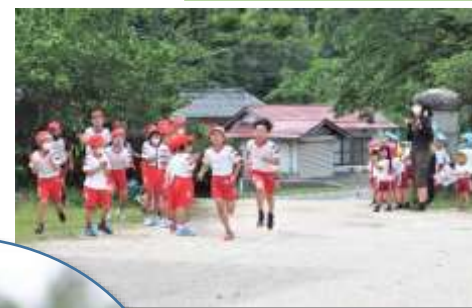
ゴール前のデッドヒート