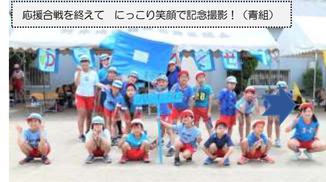
応援合戦を終えて にっこり笑顔で記念撮影！（青組）

毎年、運動会で子どもたちがエネルギーを注ぐのが応援合戦です。今年も各組ごとに応援合戦の流れをリーダーが考え、色別会で練習を重ねていきました。色別会では、思うようにいかないことも多く、振り返りの場では反省点がたくさん出てきました。どのように指示を出せば下学年に伝わるのか、組が一体となる応援にするにはどのような動きが必要か、一回一回の真剣勝負の色別会の中で、リーダーは手ごたえをつかんでいきました。