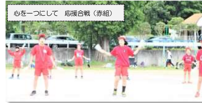
心を一つにして 応援合戦（赤組）

親子運動会を5月29日に行いました。今年のテーマは「親子魂は世界一！！阿井小パワーでウイルスをふきとばせ！」です。感染症予防の観点から午前中のみ開催となりましたが、「協力パワー」、「一生懸命パワー」を発揮して、最高の運動会を皆で作りあげることができました。保護者の皆さんには親子種目の参加のほか、会場準備・片付け、役員としてのバックアップ等様々な場面で支えていただき、ありがとうございました。