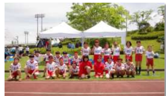
大会が終わり、にっこり笑顔で記念撮影

5月19日に小学校連合体育大会が三成陸上競技場で行われました。昨年度は新型コロナウイルス感染症拡大防止のため、残念ながら中止になりましたが、今年度は規模を縮小し5・6年のトラック種目に限って行うことになりました。阿井小の児童は、放課後や体育の時間に練習してきた成果を、公認グラウンドでしっかりと出し切ろうとする気持ちで頑張りました。自己新記録を出すことができた児童も多く、達成感に満ち溢れた表情の子どもたちでした。